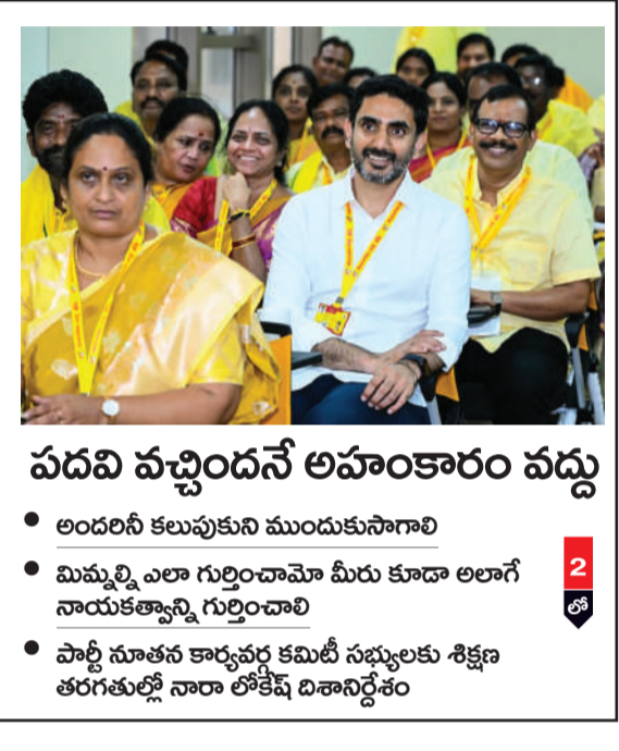
పదవి వచ్చిందనే అహంకారం వద్దు అందరినీ కలుపుకుని ముందుకుసాగాలి మిమ్మల్ని ఎలా గుర్తించామో మీరు కూడా అలాగే నాయకత్వాన్ని గుర్తించాలి పార్టీ నూతన కార్యవర్గ కమిటీ సభ్యులకు శిక్షణ తరగతుల్లో నారా లోకేష్ బిశాసనం