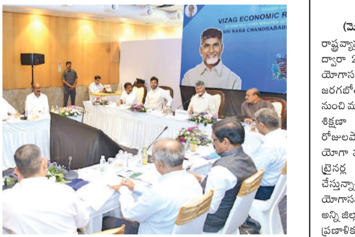
విద్యార్థులు, మేధావుల నుంచి అభిప్రాయాలు, ఆలోచనలు తీసుకోవాలని ముఖ్యమంత్రి సూచించారు. ఈ సమావేశంలో కేంద్ర మంత్రి రామోహన్ నాయుడు, మంత్రులు అచ్చెన్నాయుడు, డో.లాలి బాలిరాజుజనయన్ స్వామి, విశాఖ జిల్లాకు చెందిన ఎమ్మెల్యేలు, శ్రీకాకుళం నుంచి ఎమ్మెల్యేల వరకూ 9 జిల్లా కలెక్టర్లు, వీలవ్వతే కన్వెన్షన్, పరిశ్రమల శాఖ కార్యదర్శి యువరాజ్, రవాణా శాఖ ప్రత్యేక ప్రధాన కార్యదర్శి ఎం.టీ ప్రభుబాబు, వైద్యారోగ్య శాఖ ముఖ్యకార్యదర్శి సోదరం, ఆర్థిక శాఖ ముఖ్యకార్యదర్శి బియ్యం కుమార్, ఐటీ శాఖ కార్యదర్శి గాంధీ, అధిక శాఖ ముఖ్యకార్యదర్శి బియ్యం కుమార్, పర్యావరణ ప్రతినిధులతో సమావేశం జరిగింది.

విశాఖపట్నం (జర్నలిస్ట్ ఫైల్): బే సిటీని విశాఖ నగరాన్ని తీర్చిదిద్దేందుకు అవసరమైన కార్యాచరణ చేపట్టాలని ముఖ్యమంత్రి చంద్రబాబు నాయుడు అధికారులకు ఆదేశాలు జారీ చేశారు. విశాఖ ఎకనామిక్ డెవలప్ మెంట్ సీఎం 9 జిల్లా కలెక్టర్లు, ప్రజాప్రతినిధులు, వివిధ శాఖల ఉన్నతాధికారులతో సమీక్ష నిర్వహించారు. విశాఖలోని కైలాసగిరి నుంచి భోగాపురం వరకూ ఈ బేసిటీ ప్రాజెక్టును అభివృద్ధి చేయాలని అధికారులకు సూచించారు. వీలవ్వతే పై ఓ ప్రాజెక్టు మొదలై ఏపీ యూనిట్ ను కూడా ఏర్పాటు చేసుకోవాలని ముఖ్యమంత్రి సూచనలు ఇచ్చారు. గ్రాండ్ ప్రాజెక్టును 303 ఎకరాల్లో కన్వెన్షన్ సెంటర్ ను నిర్మించాలని ఆదేశించారు. అలాగే కైలాసగిరి ప్రాంతాన్ని అభ్యుత్థింకగా, పర్యాటక కేంద్రంగా తీర్చిదిద్దాలని స్పష్టం చేశారు. అన్ని పర్జా ప్రజలకూ ఆహ్లాదకరం కలిగించేలా బీసీ వాటర్ సౌకర్యం తో పాటు విసోలో కలిగించే వివిధ ప్రాజెక్టులు చేపట్టేలా పెట్టుబడులను ఆహ్వానించాలన్నారు. విశాఖలోని జంతు ప్రదర్శన శాలను కూడా ఆధునికీకరించి పర్యాటకుల్ని ఆకర్షించేలా చూడాలని సూచించారు. విశాఖలో ఎర్రమట్టి దిబ్బలు, బొడ్డుతీలాలను అభివృద్ధి చేయాలని సూచించారు. రాజమహేంద్రవరం లాంటి గాంధీ ప్రాజెక్టుతో పాటు, పోలవరం ప్రాజెక్టు, పాపికోండల లాంటి పర్యాటక ప్రాంతాలు అదనపు ఆకర్షణగా నిలుస్తాయని అన్నారు. ఈ ప్రాంతాల్లో మౌలిక సదుపాయాల కల్పన ద్వారా పెద్ద ఎత్తున పర్యాటక ప్రాజెక్టులు వచ్చే అవకాశముందని తెలిపారు. ఏపీ ప్రాజెక్టుల వద్ద పారిశ్రామిక ప్రాంతాలను అనుకుని ఏర్పాటు చేసే లోన్ షిప్ లు అభివృద్ధిపై కూడా దృష్టి పెట్టాలని ముఖ్యమంత్రి అందించారు. నీటి ఆయోగ్ సమర్పించిన ఏజిఆర్ ప్రాజెక్టుని నెడదీసిన ప్రజల్లో చర్చకు ఉంచాలని,