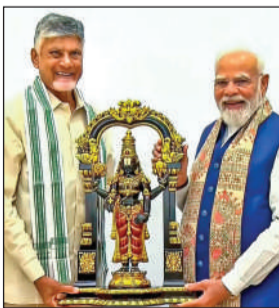
(ముదటి పేజీ తరువాయి)

ధన్యవాదాలు తెలిపారు. అమరావతిలో కేంద్ర ప్రభుత్వ సంస్థల ప్రాతినిధ్యాన్ని మరింత పెంచేలా కేంద్రం కీలక నిర్ణయం తీసుకుందని సీఎం పేర్కొన్నారు. ఆధునిక సదుపాయాలు, పర్యావరణ అనుకూల ప్రయాణాలతో కేంద్ర ప్రభుత్వ భవనాల నిర్మాణానికి ఆమోదం తెలపడం రాజధాని అభివృద్ధిలో మరో ముఖ్యమైన ముందడుగు అని తెలిపారు. అమరావతి భవిష్యత్ వృద్ధికి అవసరమైన పరిపాలనా మౌలిక వసతుల కల్పనలో ఈ ప్రాజెక్టు కీలక పాత్ర పోషిస్తుందని చంద్రబాబు పేర్కొన్నారు. రాష్ట్రంలోని కేంద్ర ప్రభుత్వ కార్యాలయాలను ఒకే ప్రాంతంలోకి తీసుకురావడం ద్వారా పరిపాలన మరింత సులభతరం అవుతుందని తెలిపారు.