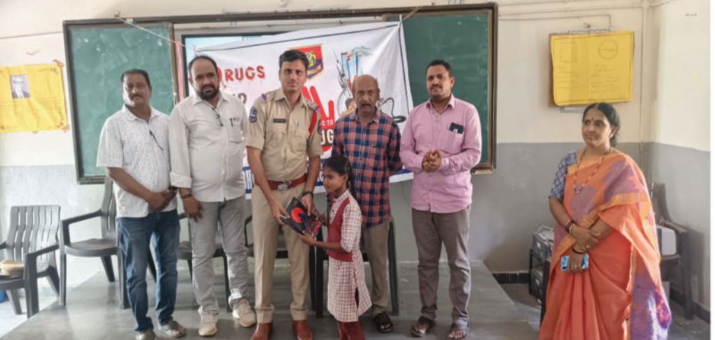
గంగాధర్, జూన్ 24 (జర్నలిస్ట్ ఫైల్) :

మాదక ద్రవ్యాల నిర్మూలన మరియు యువతలో అవగాహన