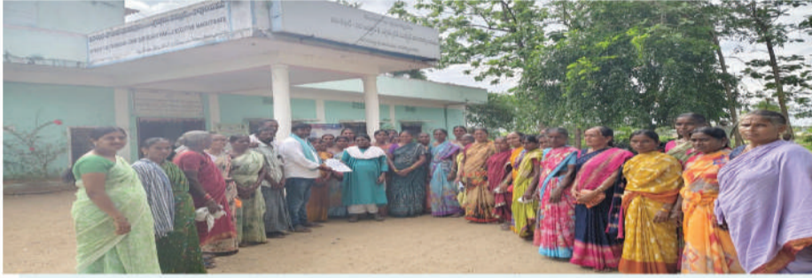
పెగడపల్లి, జూన్ 24 (జర్నలిస్ట్ ఫైల్) :