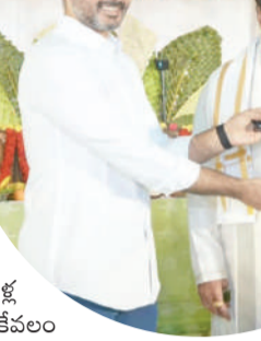
ఆంధ్రప్రదేశ్ లో తెలుగు చిత్ర పరిశ్రమ అభివృద్ధికి కూలమి ప్రభుత్వం ప్రత్యేక ప్రాధాన్యం ఇస్తోందని సినిమాలోగ్రేఫీ మంత్రి కందుల దుర్గేష్ అన్నారు. ప్రజా రాజధాని అమరావతిలో ప్రముఖ సినినటుడు నందమూరి బాలకృష్ణ నటిస్తున్న 'ఎన్టీకే 112' చిత్రం ప్రారంభోత్సవ కార్యక్రమానికి ఐటీ, ఎలక్ట్రానిక్స్ శాఖ మంత్రి నారా లోకేశ్ తో కలిసి ముఖ్య అతిథిగా హాజరైన మంత్రి దుర్గేష్ ముఖ్యారాధ్య పాత్రకు క్లాస్ కొట్టారు. వెంకటాచారిలలో జరిగిన ఈ కార్యక్రమంలో శారద్రాక్ష పూజ అనంతరం చిత్ర బృందానికి స్ట్రీప్ డ్