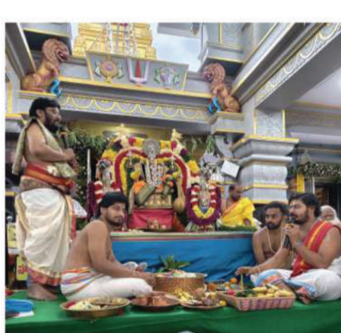
రోజైన గురువారం మహా పూజాపాతి, చక్రస్నానం నిర్వహించనున్నట్లు దేవస్నాన కమిటీ వెల్లడించింది. భక్తులు అధిక సంఖ్యలో హాజరై స్వామివారి అనుగ్రహానికి పాత్రలు వాలాలని కమిటీ సభ్యులు కోరారు.

ద్వంధువులు, మహిళలు, యువతతో పాటు పరిసర ప్రాంతాల భక్తులు విశేషంగా పాల్గొన్నారు. స్వామివారికి ప్రత్యేక పూజలు సమర్పించి తీర్థప్రసాదాలు స్వీకరించారు. ఆలయ ప్రాంగణంలో ఏర్పాటు చేసిన అన్నదాన కార్యక్రమంలో భక్తులు పెద్ద ఎత్తున పాల్గొని ప్రసాదాన్ని స్వీకరించారు. నాయత్రం విష్ణు సహస్రనామ పారాయణం భక్తిశ్రద్ధల మధ్య నిర్వహించగా, కల్యాణ మూర్తులకు 108 స్వర్ణపుష్పార్చన, కుంకుమార్చన, మూలమంత్ర హావనం, రుద్ర హావనం తదితర విశేష పూజలను వేదపండితులు శాస్త్రోక్తంగా నిర్వహించారు. అనంతరం స్వామివారి ఊరేగింపు ఆలయ పరిసర ప్రాంతాల్లో భక్తుల జయజయధ్వానాల నడుమ వైభవంగా సాగింది. కార్యక్రమాల ముగింపులో నిత్య పూజాపాతి, బలిహారణం నిర్వహించి భక్తులకు ప్రసాదాలు పంపిణీ చేశారు. చతుర్థ వారిక బ్రహ్మోత్సవాల చివరి