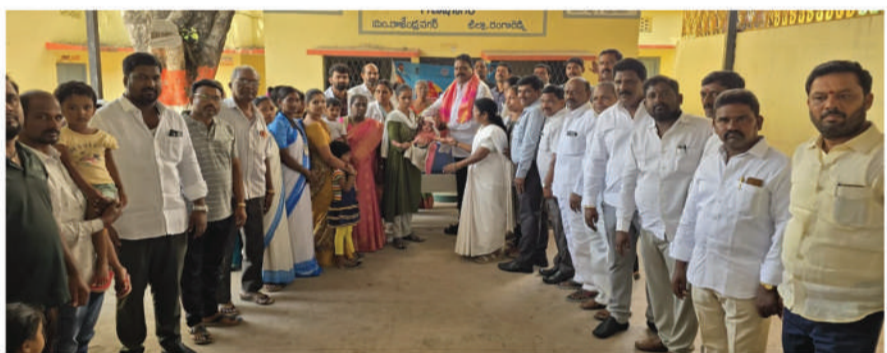
రాజేంద్రనగర్, జూన్ 29 (జర్నలిస్ట్ ఫైల్):