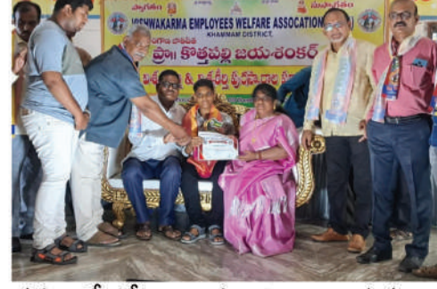
క్రమంలో వేవా రాష్ట్ర, జిల్లా నాయకులు, విద్యార్థులు వారి తల్లిదండ్రులు పాల్గొన్నారు.