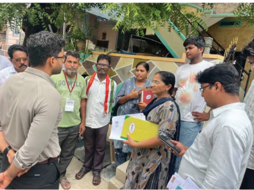
ఖమ్మం, జూన్ 30 (జర్నలిస్ట్ ఫైల్) :