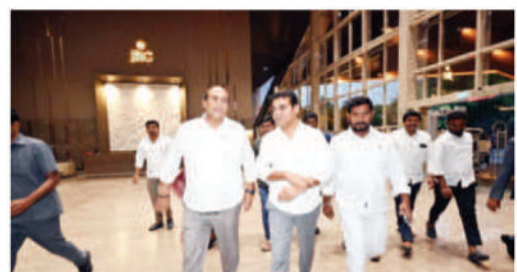
పరిరక్షించే బాధ్యతతో అప్రమత్తంగా పనిచేయాలని పిలుపునిచ్చారు. అలాగే, త్వరలో ప్రారంభం కానున్న బీఆర్ఎస్ పార్టీ సభ్యత్వ సమోదా కార్యక్రమాన్ని ప్రతిష్టాత్మకంగా