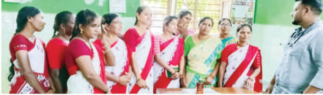
లేరు. ఒక వైద్యుడు తో వైద్య సేవలు అందిస్తున్నారు. మహిళల వైద్య చికిత్స కోసం గైనకాలజిస్ట్ అవసరమున్న ఇప్పటివరకు గైనకాలజిస్టు నియమించలేదు. పిల్లలకు సంబంధించిన వైద్య నిపుణులు అందుబాటులో లేరు. గర్భిణీ స్త్రీలకు ప్రసూతి సమయంలో సరిపడా సౌకర్యాలు లేకపోవడంతో దూరంలో ఉన్న ములుగు ప్రభుత్వ వైద్యశాలకు రిఫర్ చేస్తున్నారు. దాంతో బాలింతలు తీవ్ర ఇబ్బందులు పడతారని వస్తుంది. ఎక్స్, కనీసీ, వంటి సౌకర్యాలు లేకపోవడంతో రోగులు తీవ్ర ఇబ్బందులు పడుతున్నారు. ప్రస్తుత పరిస్థితుల దృశ్య దెంగూ

వెంకటాపురం (నూగూరు), జూలై 05 (జర్నలిస్ట్ ఫైల్) : రెండున్నర ఏళ్ల క్రితం వెంకటాపురం ప్రభుత్వ వైద్యశాలను పీహెచ్సీ నుండి 30 పడకల సిపాకే సిగా ఆబ్ గ్రేడ్ చేశామని పాలకులు చెబుతున్నా సరే సి కి సరిపడా వైద్యులు, మౌలిక సదుపాయాలు కల్పించడంలో వైఫల్యం చెందినట్లు అభిలభారత మహిళా తండ్రి మహిళా సంఘం నాయకులు ఆరోపించారు. పరిశీలించిన అనంతరం వారు మాట్లాడుతూ ఏజెన్సీ మహిళా ఆరోగ్య పరిరక్షణ కోసం వెంకటాపురం ప్రభుత్వ వైద్యశాలను ముప్పై పడకల అనుపత్రంగా ఆబ్ గ్రేడ్ చేస్తున్నట్లు ప్రకటించారు. వైద్యశాలకు ప్రతిరోజూ మండలంలోని వివిధ గ్రామాల నుంచి 200 మందికి పైగా రోగులు అనుపత్ర వస్తున్నారు. వారికి వైద్య సేవలు అందించడానికి సరిపడా వైద్యులు అందుబాటులో