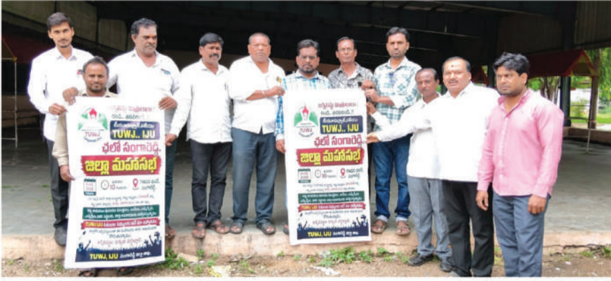
సంగారెడ్డి, జూలై 05 (జర్నలిస్ట్ ఫైల్):

ఈనెల తొమ్మిదో తేదీ రోజు సంగారెడ్డిలో టి యు డబ్ల్యూ జే (ఐ జే యు) జిల్లా మహాసభలు విజయవంతం చేయడానికి సన్నాహక సమావేశాన్ని సదాశివపేట ప్రెస్ క్లబ్ ఆధ్వర్యంలో బసవ సేవా నడన్ లో నిర్వహించడం జరిగింది. ఈ సమావేశంలో జిల్లా మహాసభకు అధిక సంఖ్యలో జర్నలిస్టులను తరలించి విజయవంతం చేయాలని టి యు డబ్ల్యూ జే నాయకులు కోరారు.