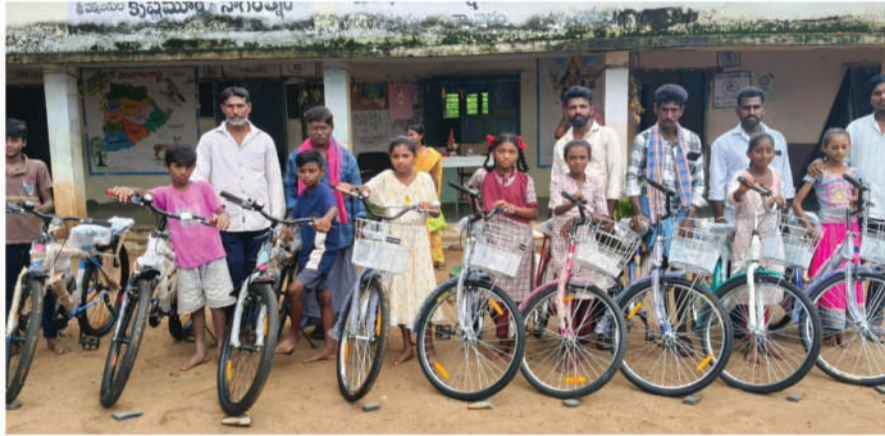
ఏన్నూరు, జూలై 05 (జర్నలిస్ట్ ఫైల్):