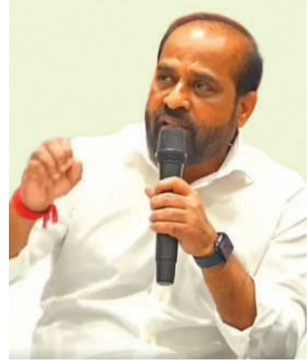
వెలి రేడియాలజీ సేవలతో రోగులకు ఉపశమనం : గత ప్రభుత్వ హయాంలో 154 ఆసుపత్రుల్లో మాత్రమే టెలి రేడియాలజీ సేవలు ఉండేవి. మిగిలిన 89 ఆసుపత్రుల్లోనూ ఈ సేవలు కల్పించాలని కూటమి ప్రభుత్వం నిర్ణయించింది. ఇప్పటికే 80 ఆసుపత్రుల్లో ఈ సేవలను ప్రారంభించింది. మిగిలిన తొమ్మిది ఆసుపత్రుల్లో ఈ సేవలు రెండు, మూడు నెలల్లో అందుబాటులోకి తీసుకురానున్నారు.

దీనివల్ల బోధనాసంపుటలపై ఒత్తిడి తగ్గడంతోపాటు రోగులను ఇతర ప్రాంతాలకు పంపి అవసరం క్రమంగా తగ్గుతోంది. గత వైకాపా ప్రభుత్వం ఐదేళ్లలో సెకండరీ ఆసుపత్రుల వైద్య పరికరాల కోసం రూ. 42 కోట్లు ఖర్చు చేయగా.. కూటమి ప్రభుత్వం కేవలం రెండేళ్లలోనే మరో రూ. 72.81 కోట్లతో కొత్త పరికరాలు, సదుపాయాలను కల్పిస్తోంది. టెలి రేడియాలజీ, సీటీ, డి.పా స్కాన్లు, కలర్ డాప్లర్ అల్ట్రాసౌండ్ యంత్రాలు, ల్యూట్రోసోపీ పరికరాలతోపాటు నవజాత శిశువుల సంరక్షణ, ప్రయోగశాల పరీక్షలకు అవసరమైన పరికరాలను ఆసుపత్రులకు అందిస్తోంది.