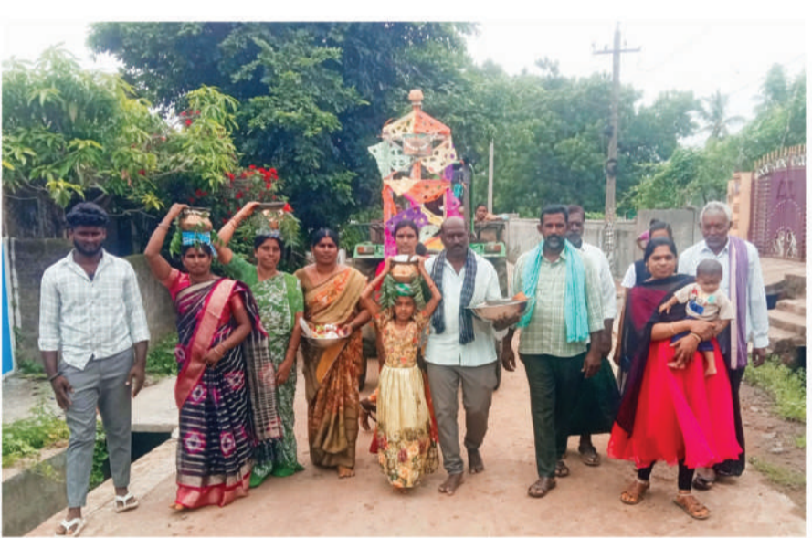
ఏన్నూరు, జూలై 06 (జర్నలిస్ట్ ఫైల్):