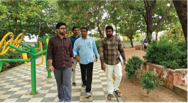
సమగ్ర అంచనాలతో ఎస్టిమేట్ సిద్ధం చేసి వెంటనే తనకు సమర్పించాలని ఇంజనీరింగ్ అధికారులను ఆదేశించారు.