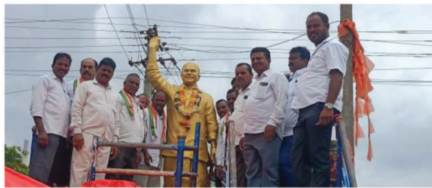
ఏస్సార్లు, జులై 09 (జర్నలిస్ట్ ఫైల్):